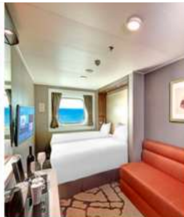
Oceanview Stateroom with Window