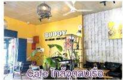
Cafe ไกล่จางเรือ