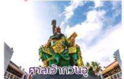
ศาลเจ้ากวนอู