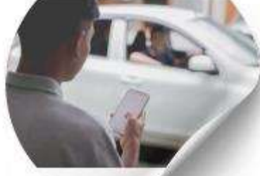
ลงเที่ยวเอง