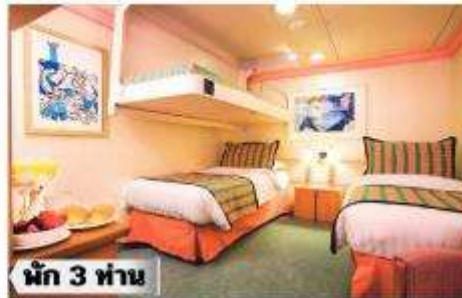
ห้องพรีเมียมจะมี Location ดีกว่า เช่น ชั้นสูงกว่าห้องคลาสสิก และ สามารถ เลือกรอบ อาหารค่ำได้