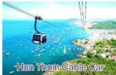
Hon Thom Cable Car