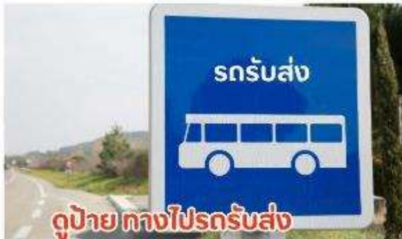
ดูป้าย ทางไปรถรับส่ง