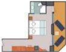
Floor Diagram Mini Suite Sleeps up to: 2 18 Cabins Cabin: 344 sqft (32 sqm) * Size may vary, see details below.