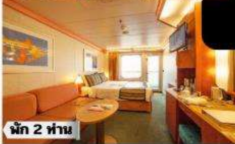
BC-Balcony Classic >> ชั้น 6