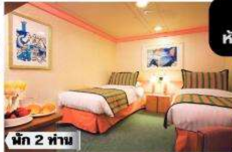
IC-Inside Classic >> ชั้น 1