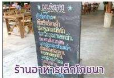
ร้านอาหารเล็กโภชนา