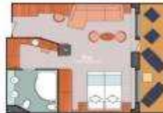
Floor Diagram Grand Suite Sleeps up to: 4 10 Cabins Cabin: 489 sqft (45 sqm) * Size may vary, see details below.