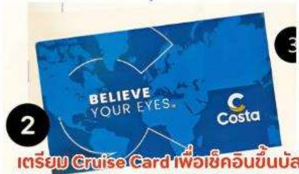
เตรียม Cruise Card เพื่อเช็คนับขึ้นบัส