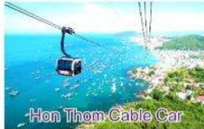
Hon Thom Cable Car