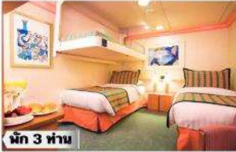
ห้องพรีเมียมจะมี Location ดีกว่า เช่น ชั้นสูงกว่าห้องคลาสสิก และ สามารถ เลือกรอบ อาหารค่ำได้