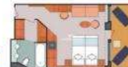
Floor Diagram Suite Sleeps up to: 3 42 Cabins Cabin: 337 sqft (31 m 2 ) * Size may vary, see details below.