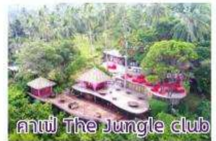
คาเฟ่ The Jungle club

16:30 น. ทุกท่านเตรียมพร้อมกับการขึ้นเรือ เพื่อออกเดินทางต่อ 18:00 น. เรือ Costa Serena อำลาเกาะสมุย มุ่งหน้า กลับสู่แหลมฉบัง ค่า รับประทานอาหารค่ำ และร่วมปาร์ตี้สนุกๆ กับพนักงานเรือเป็นการส่งท้ายก่อนกลับ