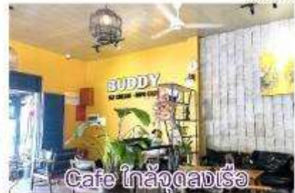
Cafe ในห้องลงเรือ

คืนนี้เรือจะพักค้างที่ปูทิว๊ก ทุกคนสามารถใช้เวลาท่องเที่ยวที่ปูทิว๊กได้อย่างเต็มที่ ทุกท่านสามารถขึ้น-ลงจากเรือได้ตลอดคืน แต่ต้องเช็คตารางเรือ Tender Boat อีกครั้ง