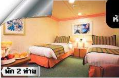
IC-Inside Classic >> ชั้น 1