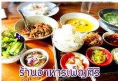
ร้านอาหารเพ็ญศรี