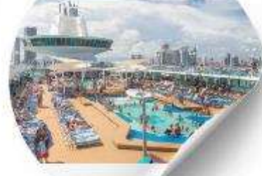
พักผ่อนบนเรือ