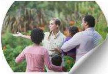
ซื้อทัวร์เสริม