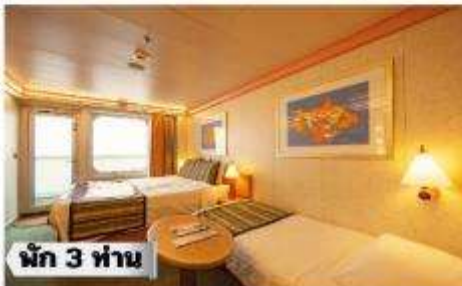
ห้องพรีเมียมจะมี Location ดีกว่า เช่น ชั้นสูงกว่าห้องคลาสสิก และ สามารถ เลือกรอบ อาหารค่ำได้