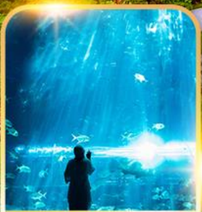
อควาเรียม