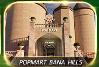
POP MART BANA HILLS

สัมผัสความงามหมู่บ้านฝรั่งเศสที่บานาฮิลล์ ช้อปปิ้ง POPMART เยือนเมืองโบราณฮอยอัน ล่องเรือกระดิง วัดหลินอึ้ง สะพานมังกร