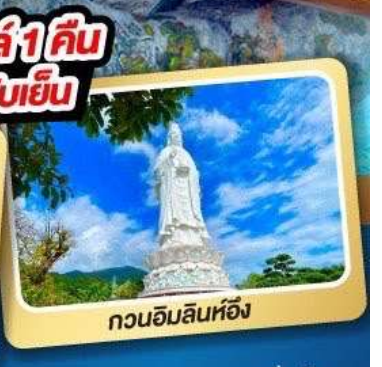
กวนอิมลินท้อ