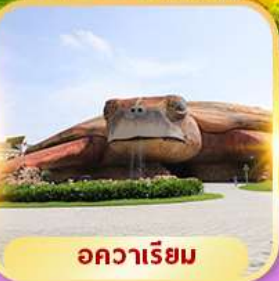
อควาเรียม