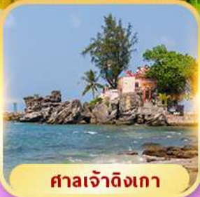
ศาลเจ้าดิงเกา