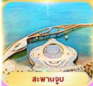
สะพานจูบ

สวนสนุก Vin Wonder + สวนน้ำ Aquatopia, Sun World Hon Thom