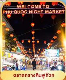
ตลาดกลางคืนฟู๊ควัก