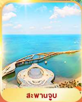
สะพานจวบ