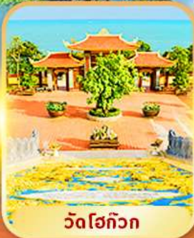
วัดโฮก๊วก