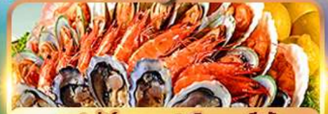
บุฟเฟ่ต์ นานาชาติ และ ซิฟู้ด