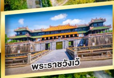
พระราชวังเว้