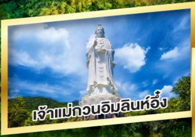
เจ้าแม่กวนอิมสินห์อึ้ง