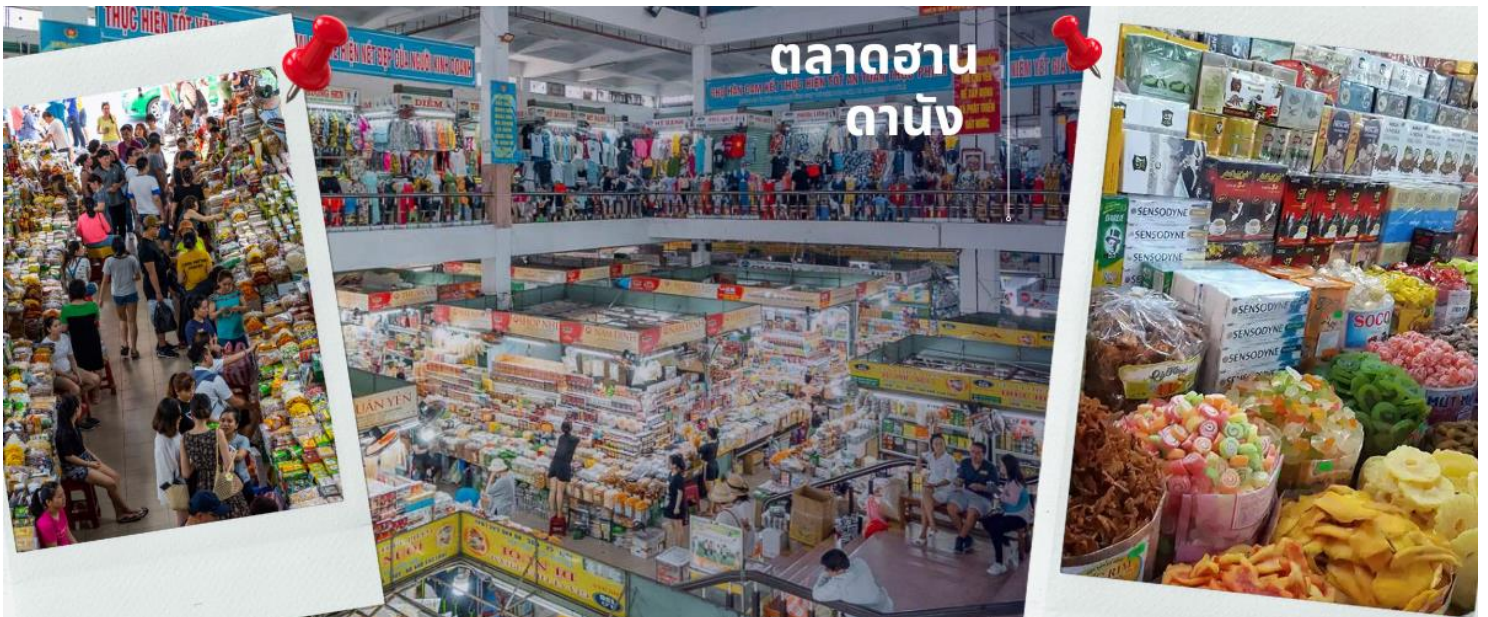
ตลาดฮาน ดานัง

นำท่านไปละลายทรัพย์ที่ ตลาดฮาน เป็นตลาดที่รวบรวมสินค้ามากมายเป็นที่นิยมทั้งชาวเวียดนามและชาวไทย อาทิ เสื้อเวียดนาม หมวก รองเท้า กระเป๋า สินค้าพื้นเมือง โดยเฉพาะงานฝีมือ อาทิ ภาพผ้าปักมืออันวิจิตร คอมพิวเตอร์ ผ้าปัก กระเป๋าปัก ตะเกียบไม้แกะสลัก ชุดอ่าวหาย่าย(ชุดประจำชาติเวียดนาม) ไว้เป็นที่ระลึกมากมายเพื่อฝากคนที่บ้าน