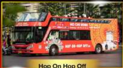
Hop On Hop Off