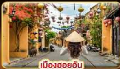
เมืองฮอยอัน