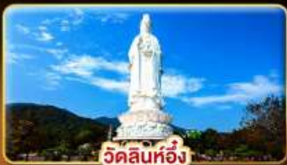
วัดลินห์ฮิ่ง