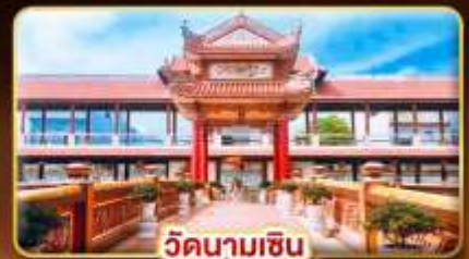
วัดนามเชิน