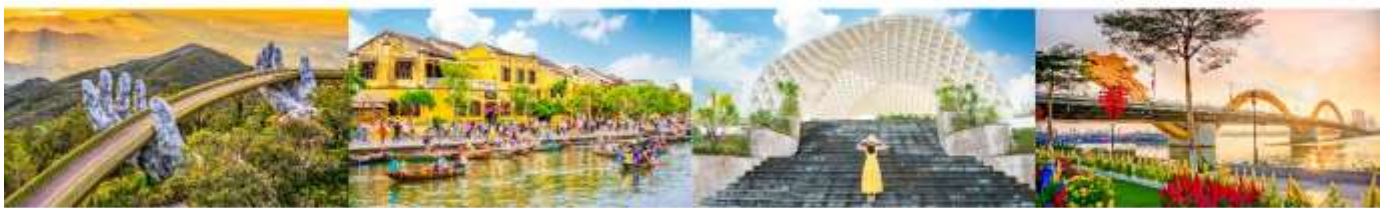
บานาฮิลล์