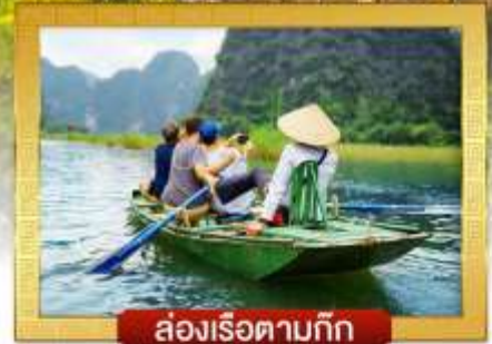
ล่องเรือตามก๊ก