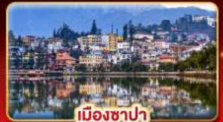
เมืองซาปา