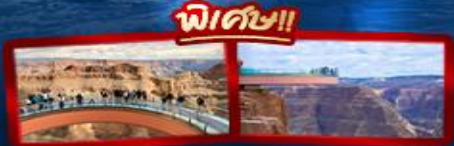
ชมความยิ่งใหญ่ของ GRAND CANYON WEST SKYWALK

อเมริกาตะวันตก ลอสแอนเจลิส ลาสเวกัส ซานฟรานซิสโก