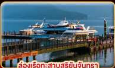
ส่งเรือทะเลสาบสุริยจันทร์

"นั่งรถไฟชมอุทยานอาลีซาน" ปล่อยคอมลอยเส้นทางรถไฟผิงซี