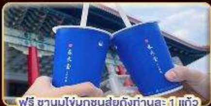
ฟรี ชานมไข่มุกชงสดถึงท่านละ 1 แก้ว