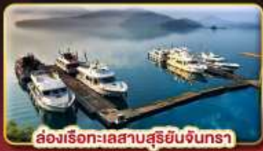
ล่องเรือทะเลสาบสุริยัมจินตรา