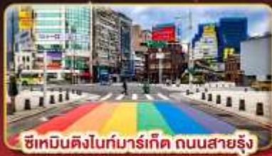
ซีเหมินติงไนท์มาร์เก็ต ถนนสายรุ้ง