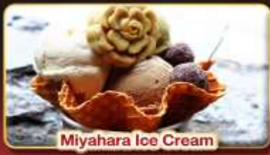
Miyahara Ice Cream

มหานครแห่งเมืองสี่สี "ไทเป" ช้อปปิ้งจุใจ 3 ตลาดกลางคืนชื่อดัง