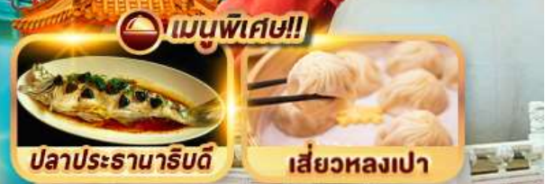
ปลาประธาราธิบดี