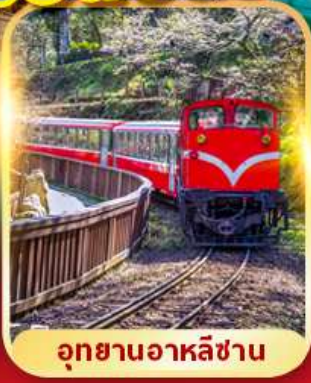
อุทยานอาหลี่ซาน