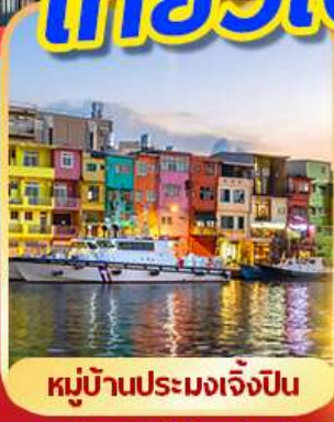
หมู่บ้านประมงเจ็ปโป

พักช้อปปิ้งถึง 1 คืน เที่ยวเต็ม!! ไม่มีอันอิสระ