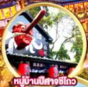
หมู่บ้านปี่ศาจชิวโกว