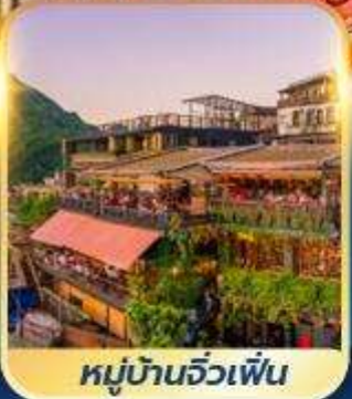
หมู่บ้านจิวเฟิ่น