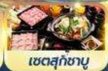
เซตสุกัซามู