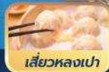
เสี่ยวหลงเป่า