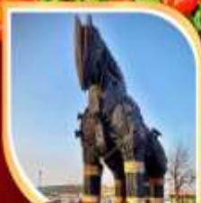
น้ำไม้แห่งทรอย