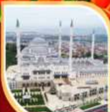
บัสยิดคัมลิกา