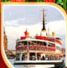
ล่องเรือเฟอร์รี่