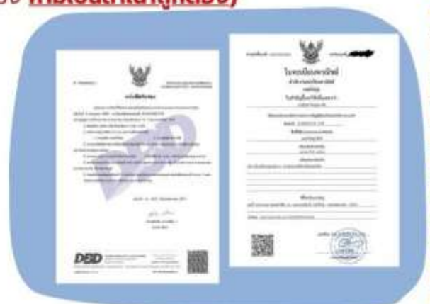
ตัวอย่างหนังสือจดทะเบียนบริษัทฯ และ ใบทะเบียนพาณิชย์