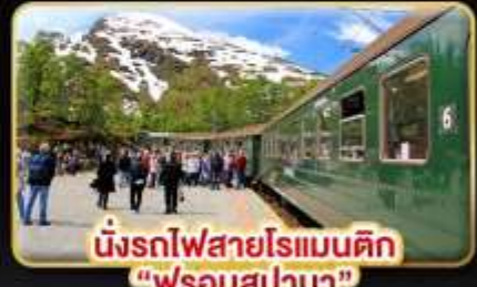
นั่งรถไฟสายโรแมนติก “ฟรอมสปาน่า”