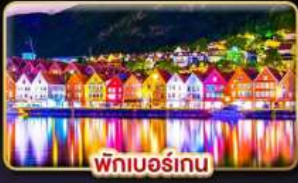
พักเบอร์เกน