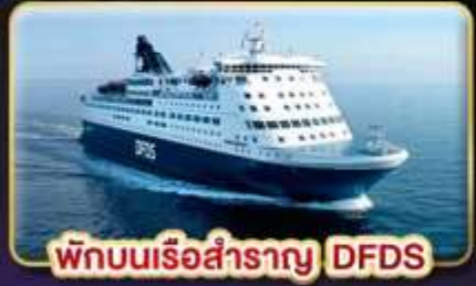
พักบนเรือสำราญ DFDS