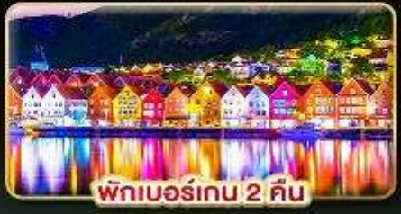
พักเบอร์เกน 2 คืน