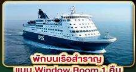
พักผ่อนเรือสำราญ แบบ Window Room 1 คืน

118,999.- ราคา เพียง เดินทางเทศกาลสงกรานต์ 11-19 เม.ย. 68