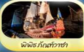
พิพิธภัณฑ์ทิวาชา