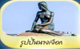
รูปปั้นนางเงือก

อาหาร 14 มื้อ + บนเครื่อง บริการน้ำดื่มวันละ 1 ขวด ฟรี! ปลั๊กไฟ Universal