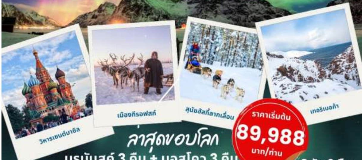
วิหารเซนต์บาซิล