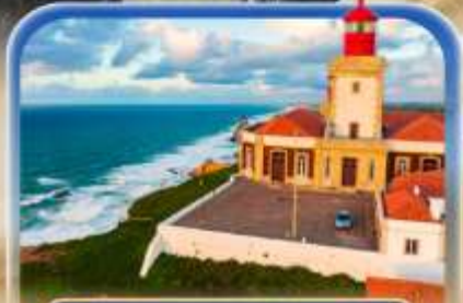
เขื่อนแหลมโรคา