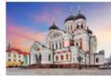
โบสถ์อเล็กซานเดอร์ เนฟสกี

19.35 น. ออกเดินทางสู่อิสตันบูล เที่ยวบิน TK1424