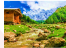
ยอดเขานังกาพาร์บัด

** พักที่ Raikot Sarai Hotel หรือเทียบเท่า **