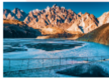
สะพานแขวนอุสโซนิ