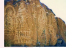
เมืองซีลาส

** พักที่ Shangrila Chilas Hotel หรือเทียบเท่า **