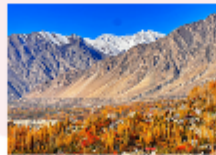
หุบเขาพาสสุ

** พักที่ Sarai Silk Route Hotel หรือเทียบเท่า **