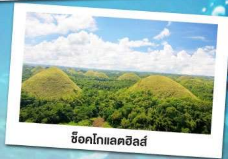
ช็อคโกแลตฮิลล์