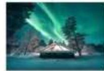
Glass Igloo Hotel

** พักที่ NORTHERN LIGHTS VILLAGE OR SIMILAR **