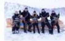
สนุกกับกิจกรรมจับปูยักษ์

00.00 น. ออกเดินทางสู่ เมืองคีร์กเคนเนส โดยสายการบิน...เที่ยวบินที่... 00.00 น. เดินทางถึงสนามบินเมืองคีร์กเคนเนส