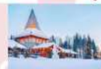
หมู่บ้านซานต้าครอส

15.25 น. ออกเดินทางสู่อิสตันบูล ประเทศตุรกี เที่ยวบินที่ TK 1750