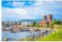
เมืองออสโล

06.10 น. เดินทางถึงนครอิสตันบูล ประเทศตุรกี (แวะเปลี่ยนเครื่อง) 09.00 น. ออกเดินทางสู่กรุงออสโล ประเทศนอร์เวย์ เที่ยวบินที่ TK 1751 11.00 น. เดินทางถึงสนามบินสนามบินเมืองออสโล