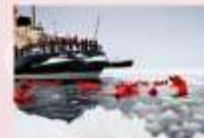
ล่องเรือตัดน้ำแข็ง Ice Breaker