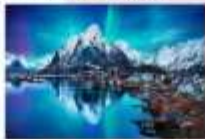
หมู่เกาะโลโฟเทน

00.00 น. ออกเดินทางสู่ เมืองเลกเนส โดยสายการบิน Scandinavian Airlines เที่ยวบินที่ SK 4106 แวะเปลี่ยนเครื่องที่เมือง Bodo เป็นสายการบิน Wide roe WF 810 00.00 น. เดินทางถึงสนามบินเมืองเลกเนส