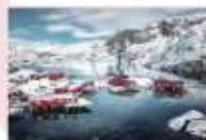
หมู่บ้าน Nusfjord

** พักที่ ELIASSEN RORBUER OR SIMILAR **