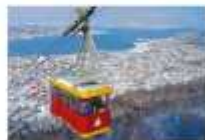
Tromsø Cable Car

** ที่พัก CLARION HOTEL THE EDGE OR SIMILAR **