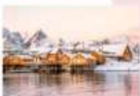
หมู่บ้าน Sakrisoy