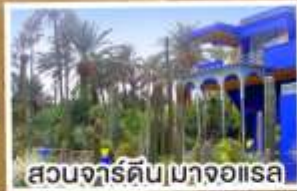
สวนจาร์ดิน|มาจออเรล