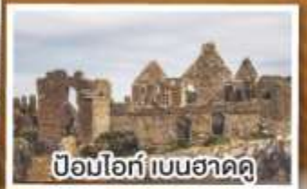
ป้อมโอ๊ก์ เบนฮาดดู