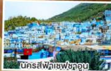
นครสีฟ้าเซฟซาอูน