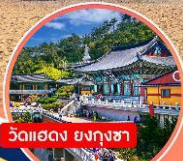
วัดแฮดง ยงกุงซา