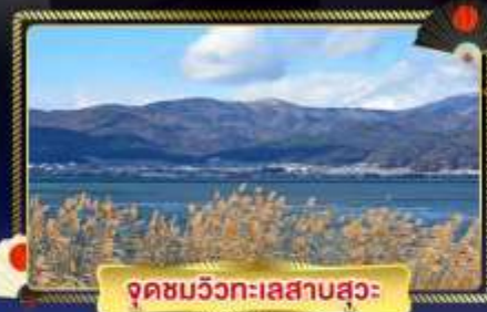
จุดชมวิวกะเลสาบสุวะ