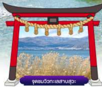
จุดชมวิวกะเลสาบสุวะ