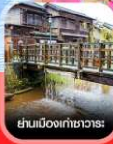
ย่านเมืองเก่าซาวาระ

คอนเฟิร์ม ออกเดินทาง ทุกพีเรียด 2 ท่านขึ้นไป