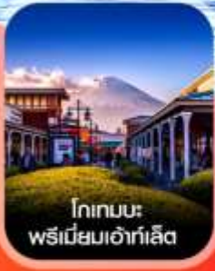
โทกอนะ พรีเมียมเอาท์เล็ต