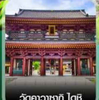
วัดคาวาซากิ ไตชิ