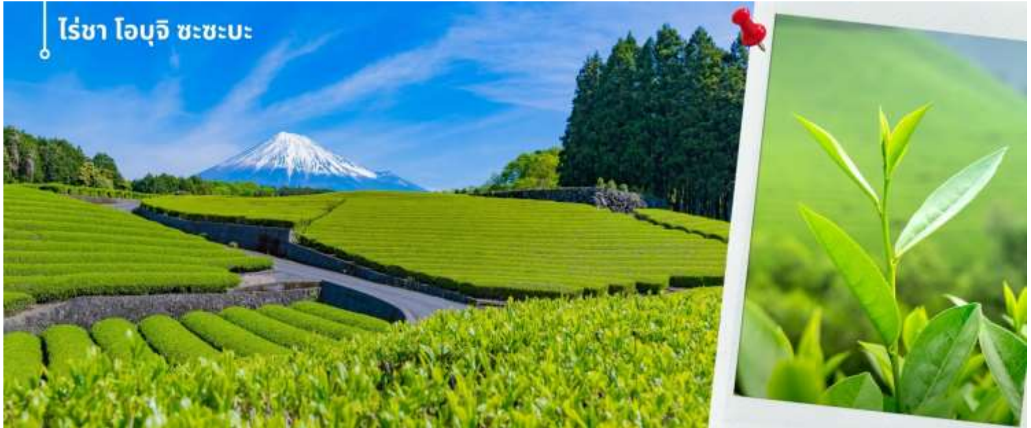
ไร่ชา โอบุจิ ซะซะบะ

หลังรับประทานอาหารเที่ยง นำท่านเดินทางสัมผัสบรรยากาศไร่ชาสไตล์ญี่ปุ่น “มัทฉะ (Matcha)” เป็นรสชาติที่ได้รับความนิยม มีต้นกำเนิดอยู่ในญี่ปุ่น ผลิตขึ้นจากชาเขียวหรือที่เรียกว่า “เรียวกุฉะ (Ryokucha)” และสถานที่ซึ่งเป็นแหล่งผลิตชาเขียวที่มีชื่อเสียงแห่งหนึ่งในญี่ปุ่น ไร่ชาโอบุจิ ซะซะบะ (Obuchu Sasaba) ตั้งอยู่ใกล้กับภูเขาไฟฟูจิ ในจังหวัดชิซุโอกะ (Shizuoka) ที่รู้จักกันดีว่าเป็นภูมิภาคที่มีการผลิตชาชั้นนำของประเทศญี่ปุ่น ไร่ชาแห่งนี้โดดเด่นในเรื่องของวิวทิวทัศน์ที่สวยงาม ในวันที่ฟ้าเปิด จะสามารถมองเห็นภูเขาไฟฟูจิได้อีกด้วย บรรยากาศที่สวยงามกับไร่ชาสีเขียวพร้อมกับพื้นหลังเป็นภูเขาไฟฟูจิ ให้ท่านได้อิสระเก็บภาพบรรยากาศภายในไร่ชา ตามอัธยาศัย