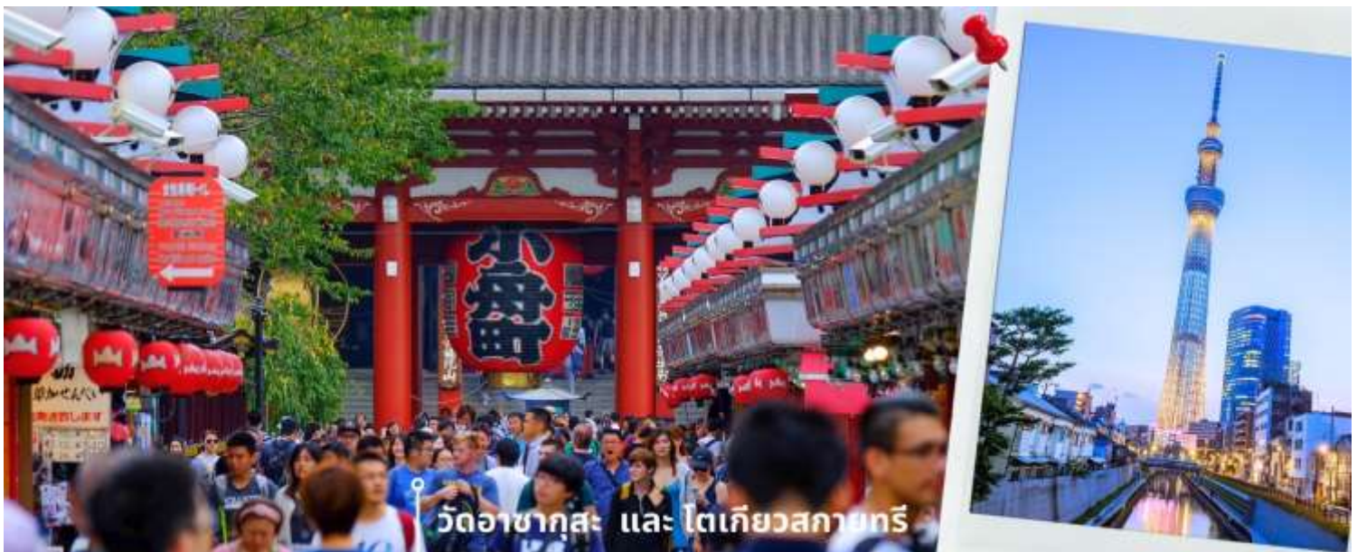
วัดอาซากุสะ และ โตเกียวสกายทรี

08.00 น. เดินทางถึงสนามบินนาริตะ ประเทศญี่ปุ่น หลังจากผ่านพิธีตรวจคนเข้าเมืองและศุลกากรแล้ว นำท่านขึ้นรถโค้ชปรับอากาศ จากนั้นเดินทางสู่ เมืองโตเกียว พาท่านสักการะ ที่ วัดอาซากุสะ (Asakusa Temple) วัดที่ได้ชื่อว่าเป็นวัดที่มีความศักดิ์สิทธิ์และได้รับความเคารพนับถือมากที่สุดแห่งหนึ่งในกรุงโตเกียวภายในประดิษฐานองค์