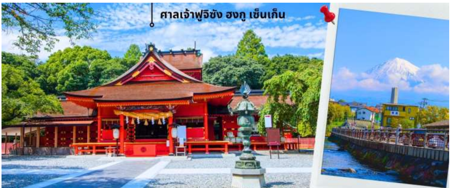
ศาลเจ้าฟูจิซัง ฮงกุ เซ็นเก็น

จากนั้นนำท่านไปสักการะ ศาลเจ้าฟูจิซัง ฮงกุ เซ็นเก็น ไทฉะ (Fujisan Hongu Sengen Taisha) ศาลเจ้าอายุเก่าแก่กว่า 1,000 ปี สร้างขึ้นเพื่อเป็นการบวงสรวงเทพเจ้าของภูเขา เพื่อให้หยุดการปะทุของภูเขาไฟฟูจิในช่วงที่มีการระเบิด ถือเป็นศาลเจ้าที่สำคัญที่สุดของภูมิภาค นอกจากนี้ศาลเจ้าฟูจิซัง ฮงกุ เซ็นเก็น ไทฉะ ยังเป็นส่วนหนึ่งของมรดกโลกทางวัฒนธรรมภูเขาฟูจิ