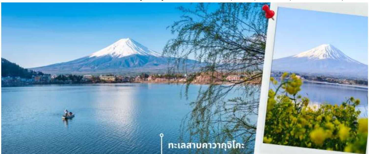
ทะเลสาบคาวากูจิโกะ

หลังรับประทานอาหารเช้า นำท่านแวะชม พิพิธภัณฑสถานแผ่นดินไหว เป็นพิพิธภัณฑสถานี่แสดงถึงผลกระทบจากภัยพิบัติแผ่นดินไหวและการระเบิดของภูเขาไฟ ภายในพิพิธภัณฑสถานี่มีห้องจัดแสดงข้อมูลการประทุของภูเขาไฟจากทุกมุมโลก โซนความรู้ต่างๆและโซนข้อปั้งสินค้าญี่ปุ่นอาทิเช่น ผลิตภัณฑ์เครื่องสำอางและของฝากอีกมากมาย พอสมควรแก่เวลานำท่านเดินทางสู่ ทะเลสาบคาวากูจิโกะ (Lake Kawaguchiko) ในจังหวัดยามานาชิ แหล่งท่องเที่ยวที่อยู่ไม่ไกลจากโตเกียว (Tokyo) หนึ่งในที่ที่เยวญี่ปุ่นยอดฮิตตลอดกาล ทะเลสาบที่กว้างใหญ่เป็นอันดับ 2 ของ 5 ทะเลสาบรอบภูเขาไฟฟูจิ อยู่บริเวณเชิงภูเขาไฟ ความสูงกว่าระดับน้ำทะเลประมาณ 800 เมตร ทำให้สภาพอากาศบริเวณนี้เย็นสบายตลอดปี รายล้อมไปด้วยธรรมชาติที่อุดมสมบูรณ์ และทิวทัศน์สวยงามตลอดปี ในช่วงเวลาที่พลาดไม่ได้เลยที่จะได้ชื่นชมดอกซากุระบาน คือในช่วงปลายเดือนมีนาคมจนถึงต้นเดือนเมษายน จะบานสะพรั่งสวยงามเรียงรายริมทะเลสาบ สามารถชมวิวดูทั้งทะเลสาบและภูเขาไฟฟูจิได้อย่างชัดเจน นับเป็นจุดชมซากุระยอดฮิตที่สุดอีกแห่งหนึ่งในญี่ปุ่น