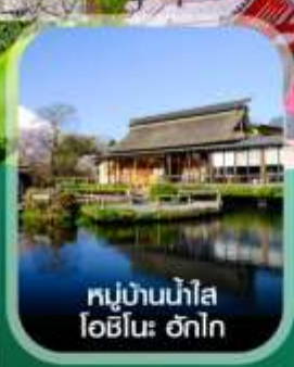
หมู่บ้านน้ำใส โอชิโนะ อักโก