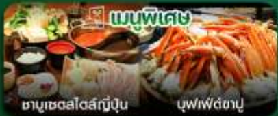
เมนูพิเศษ ซาซิมิสดปลาสดญี่ปุ่น บุฟเฟ่ต์ซาซิมิ

วัดอาซากุสะ-ถนนนากามิเซะ-พิพิธภัณฑ์แผ่นดินไหว-ไร่ชาโอบุจิ ชะชะบะ-ไคเซอร์ชิตี โอไดบะ-ตลาดปลาชิกิจิ