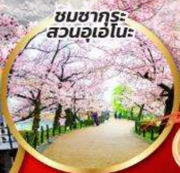
ชมซากุระ สวนอุเอโนะ