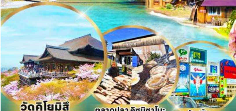
วัดคิโยมิสึ