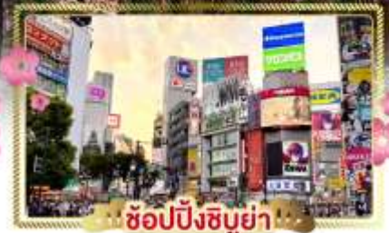
ช้อปปิ้งชิบูย่า