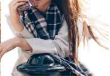
โรงงานช็อคโกแลต "อิชิยะ" (Ishiya Chocolate Factory)

ท่านสามารถชมขั้นตอนการทำช็อคโกแลตที่ขึ้นชื่อของเมืองซัปโปโร โดยเฉพาะSHIROI KOIBITO ขนมสอดไส้ช็อคโกแลตขาวที่เป็นที่นิยมทั่วทั้งเกาะฮอกไกโด และพิพิธภัณฑ์ช็อคโกแลต ชมถ้วยชามที่ใช้สำหรับใส่ช็อคโกแลตที่มีความสวยงามเป็นเอกลักษณ์ และเหล่าของเล่นย้อนยุคที่ทำให้คุณ ๆ ต้องแอบอมยิ้มอยู่ในใจ และรู้สึกเหมือนย้อนเวลากลับไปในอดีตอีกครั้ง และแนะนำให้ท่านชิมชา หรือกาแฟร้อนของที่นี่ พร้อมทั้งสิ่งขนมเค้กแสนอร่อยราดด้วยช็อคโกแลตเข้มข้น ในส่วนที่เป็นคอฟฟี่ช็อป บริเวณชั้น 2 ของอาคารทรงสไตล์ยุโรป (อิสระให้ท่านถ่ายรูปบริเวณด้านนอก ไม่รวมตัวค่าเข้าชมภายใน)