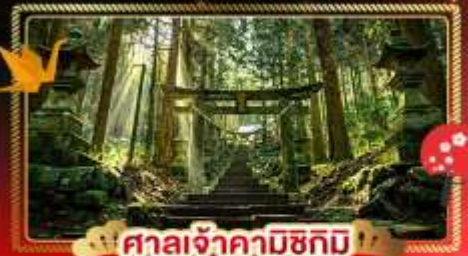
ศาลเจ้าคามิซึมิ