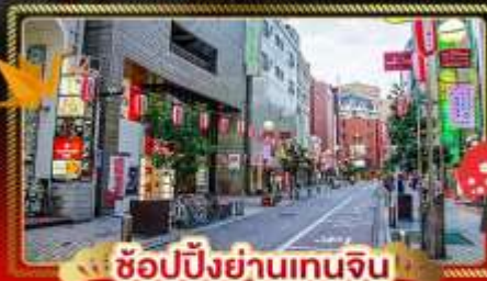
ช้อปปิ้งย่านเทนจิน