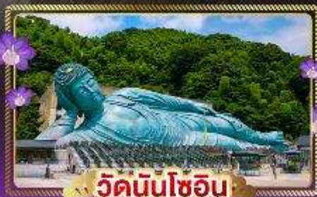
วัดนินโซอิน