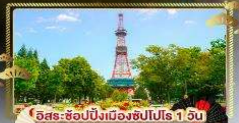
อิสระ-ช้อปปิ้งเมืองซัปโปโร 1 วัน