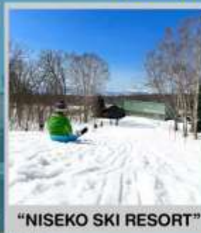
"NISEKO SKI RESORT"