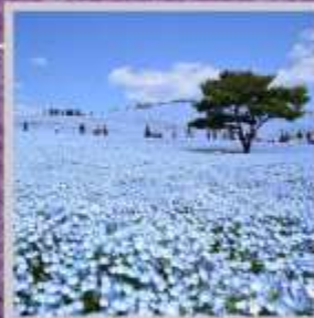
"HITACHI SEASIDE PARK"