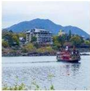
ล่องเรืออปปะระ