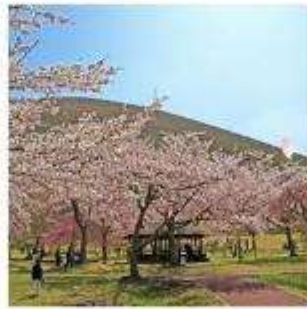
ซากุระ โนะ ซาโตะ