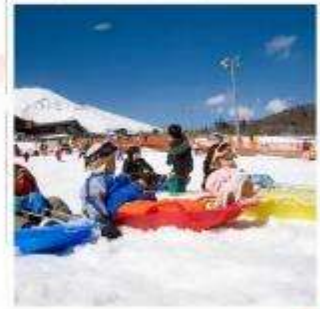
ลานสกีเยติ