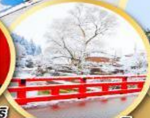
สะพานนากะบะชิ