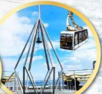
นั่งกระเช้าชมวิวเมืองซัปโปโร MT.MOIWA