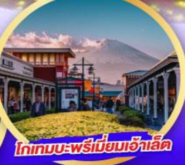
โทเทมบะ-พรีเมียมเฮ้าส์