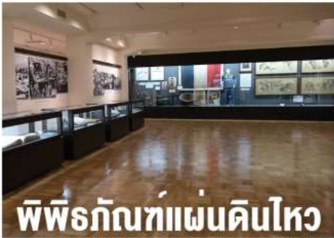
พิพิธภัณฑท์แผ่นดินไหว

นำท่านสู่ DUTY FREE ช้อปปิ้งสินค้าปลอดภาษีต่างๆ ตามอรรถาศัย จากนั้นนำท่านเดินทางสู่ เมืองนาโกย่า เดินทางสู่ ย่านการค้าชานาคะ เอะ ให้ท่านได้อิสระเพลิดเพลินกับการช้อปปิ้ง มีร้านรวมประมาณ 1100 ร้าน โดยย่านนี้จะมีห้างดังเช่น PARCO, MITSUKOSHI, DONGI, LOFT, BIG CAMERA, BOOK OFF, ร้าน 100 เยน พร้อมทั้งร้านขายเสื้อผ้า รองเท้า พร้อมทั้งยังมีร้านอาหารหลากหลายชนิดให้ได้เลือกซื้อเลือกทานอีกด้วย